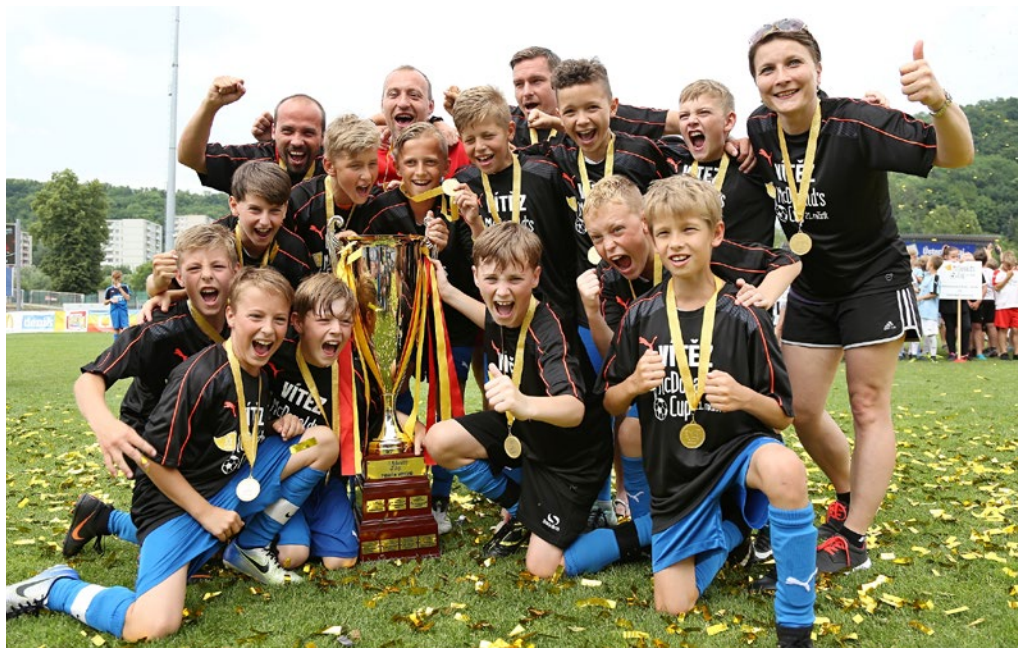
ZŠ Klegova, Ostrava

V 21. ročníku McDonald's Cupu se od okrskových kol po celostátní finále zapojilo 51 184 kluků a holek z prvního stupně základních škol, další tisíce pak v kolech školních.