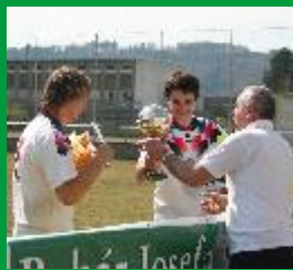
POHÁR JOSEFA MASOPUSTA