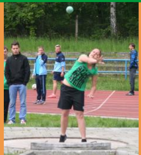
ATLETICKÝ POHÁR ROZHLASU