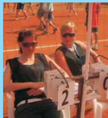
RF PECKA 7.-9. 6. 2010