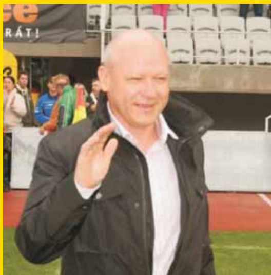
Svátek fotbalu navštívil i prezident ČMFS Ivan Hašek a zahrál si i v utkání hvězd proti týmu McDonald's.